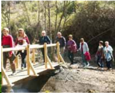
L'abans i el després de la Font del Ferro

Vam començar amb la restauració del molí i l'any passat es va emprendre la recuperació de la Font del Ferro: Es va fer una font de pedra, nova, una bassa per amfibis i -en col·laboració amb el CAU de Pineda- un pont de fusta. Es va netejar tot el terreny de romagueres i es van plantar arbres de ribera.