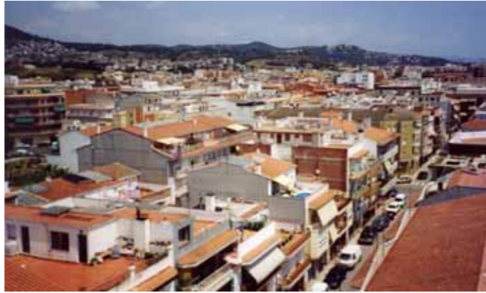
L'ARE significa urbanitzar tota la zona lliure entre Pineda i Poblenu i crear un continu urbà des del far de Calella al cementiri de Pineda

Enmig de tot aquest procés la participació ciutadana no ha quedat gaire ben parada. L'ARE actual és hereva del Pla Parcial que ja fou aprovat inicialment, pel govern municipal, el gener de 2003. Llavors s'efectuà sense debat i per la via d'urgència. L'aprovació del pla parcial el 2003 donava llum verda a la urbanització ja prevista a través de Pla General de 1992. Per això Pineda, malauradament, no és el cas d'altres municipis que han portat a referèndum l'ARE i on la població podia decidir entre urbanitzar o no urbanitzar aquests espais. Aquí la decisió ja es va prendre fa temps i sense oferir cap opció a la ciutadania per pronunciar-se al respecte. Amb tots aquests antecedents a la mà, no deixa ser simptomàtic que, al llarg de tot el període que ha durat la tramitació de l'ARE (prop d'un any), a Pineda no s'hagi convocat un sol acte públic per informar-ne al respecte i que, per la seva banda, la Generalitat ni tan sols s'hagi pres la molèstia de respondre les al·legacions que van presentar entitats com la nostra.