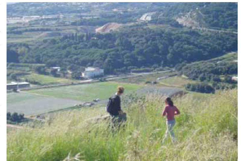
Pocs pobles poden disfrutar d'un espai natural tan pròxim al poble com el de la Vall de la Riera

Fins i tot en un primer moment va semblar que l'actual ajuntament havia fet el pas valent i decidit que li marcava l'Agenda 21, que exigia la desclassificació immediata d'aquest espai. Però no, amb l'ambigüitat calculada pròpia dels polítics, un cop més hem jugat a les mitges tintes, hem aigualit les aspiracions d'una bona part dels pinedencs que volen conservar una part del ric patrimoni pagès del poble i que tenen ganes de poder fruit d'un espai verd a tocar del poble. S'ha perdut l'ocasió de barrar el pas a qualsevol mena d'especulació de futurs negocis immobiliaris o d'ocupació d'aquest espai per usos no-agrícoles.