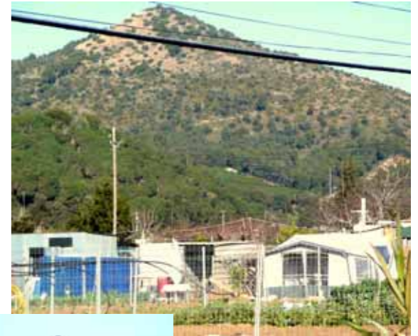
Rulots i tota classe de construccions improvisades en una mena de càmping il·legal a la Vall de la Riera. Al fons, el Montpalau..

A hores d'ara la canonada ja s'ha instal·lat; si en curt termini no s'inicien les obres de restitució de l'arbrat recordarem a ATLL els seus compromisos i a l'ajuntament, perquè, de manera subsidiària, vetlli pel seu compliment.