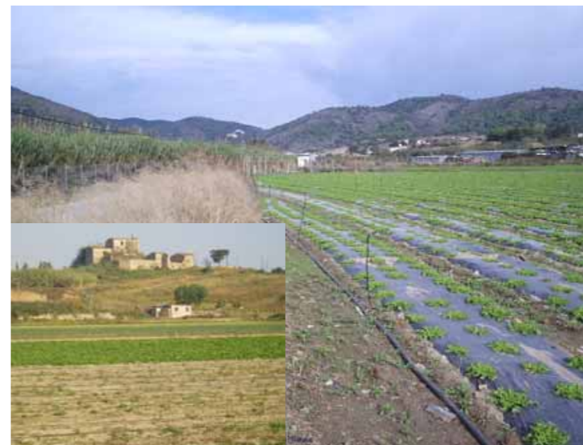
La Vall de la Riera emmarcada per la serra de la Guàrdia i el Montnegre al fons i -a la foto petita- la zona de Can Roig, la més pròxima al poble

Però la Plataforma no tira la tovallola i continuarà exigint a aquest ajuntament que tingui la valentia de fer el pas definitiu. L'argumentació per desclassificar la part de la Vall de la Riera que s'havia de destinar a úsos industrials és que ja hi ha un polígon industrial amb prou capacitat per cobrir aquestes necessitats. El projecte d'urbanització de la zona compresa entre Pineda Centre i Poblenou (l'ARE, antic PP1) ens dona un argument més per demanar que s'aturi aquí el creixement del poble. La zona encara urbanitzable de la Vall de la Riera (el 60% del total!) no es pot convertir en una mena de reserva de sòl per continuar creixent. Ni tampoc en un espai per anar-hi col·locant equipaments que exigeix el creixement urbanístic descontrolat i desmesurat de l'ARE entre Pineda i Poblenou i que no s'hagi tingut la previsió de col·locar on pertoca.