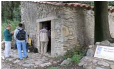
El forn fariner de Can Marquès ja restaurat