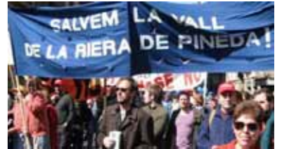
8 anys reivindicant la protecció integral de la Vall de la Riera

La desclassificació d'una part de la Vall de la Riera, la que està més allunyada del poble, ens ha provocat sentiments contradictoris: d'una banda la immensa satisfacció de veure preservada una part d'aquesta vall agrícola, amb un valor paisatgístic tan gran i que fa de transició entre el nucli urbà de Pineda i el Montnegre, i de l'altra la sensació d'haver-nos quedat a mitges i d'haver desapropiat l'oportunitat de deixar ben clar quin volem que sigui el destí de la Vall de la Riera.