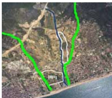
En blau, la riera de Pineda. Les ratlles verdes serien els límits del connector biològic entre el mar i el Montnegre. Encerclat en blanc el PPI, ara ARE.

6.- Com a entitat instem l'ajuntament per tal que, a curt termini, finalitzi la desclassificació del sòl urbanitzable encara vigent a la Vall de la Riera i que doni compliment a l'Agenda 21 que va aprovar l'any 2005.