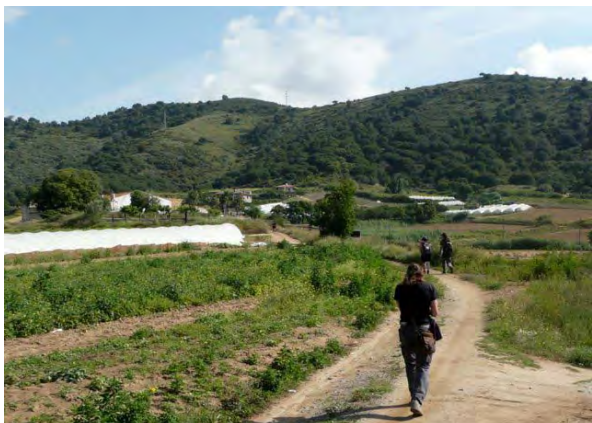
La vall de la Riera ha de ser un espai agrícola i natural patrimoni del poble: és responsabilitat del nostre ajuntament vetllar perquè ho sigui