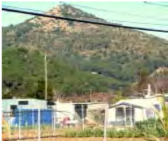
Rulots, grans tendes de càmping, piscines, antenes de TV: un autèntic càmping il·legal en un sector de la Vall de la Riera