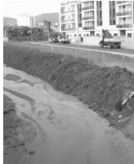
Ara mateix s'està construint a tocar de la riera!

treballant amb els biòlegs del Projecte Rius, hem anat perfilant la nostra idea de com s'hauria de fer aquesta regeneració. De fet tenim un avantprojecte que marca les línies mestres de tot això i que va fer de forma desinteressada una enginyeria de Riudellots. Aquest avantprojecte l'hem presentat també a l'ajuntament, per mirar d'aconseguir la implicació dels nostres polítics, i aposta per un eixamplament de la llera de la riera i per una reducció del pendent dels marges o talussos, i també es proposa la divisió dels marges en dues meitats, un d'inferior i un altre de superior. Entre el marge superior i l'inferior s'establiria un corriol pel pas de passejants i bicicletes. D'acord amb el que recomana l'ACA en matèria de seguretat hídrica, el talús inferior s'ha dimensionat per garantir el pas de les aigües per una rierada o crescuda hipotètica amb un període de retorn de 100 anys,