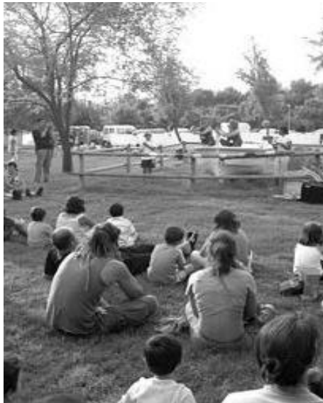
El Parc del Litoral de Sant Pol, també al costat de la riera