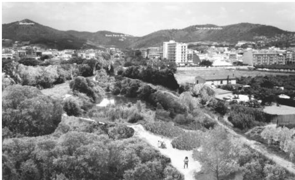
Fotomuntatge del projecte de la Plataforma

També cal dir que vam rebre un recolzament popular important al referèndum que vam organitzar a l'edició passada de la fira de la primavera a la plaça de les Mèlies, amb més de 500 vots a favor del Parc Central de la riera, a part del d'entitats ciutadanes com ara l'associació de veïns de Can Pelai (que estarien tocant a la zona on s'ubicaria aquest parc). O del de la gent que ens ha animat sempre que hem muntat "la parada" a la plaça de les Mèlies o que hem fet actes públics. L'últim, precisament, va ser la presentació del nostre "projecte de millora pel tram final de la riera" a la Biblioteca Serra i Moret, ara fa un parell de mesos.