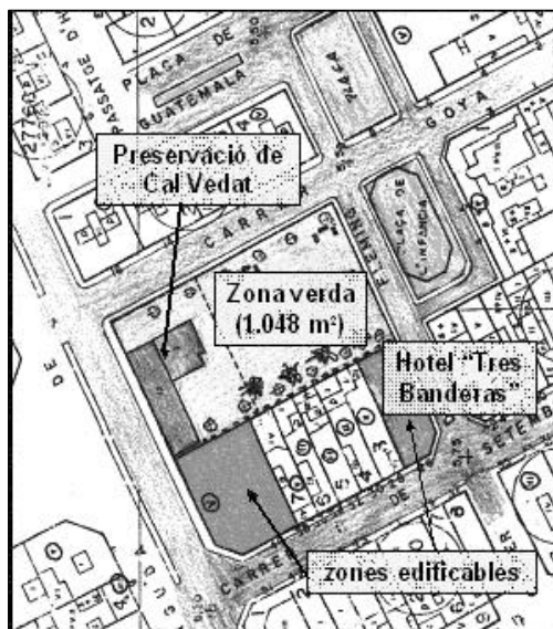
Contraproposta que la Direcció General d'Urbanisme ha presentat a l'ajuntament

El conveni que s'havia signat entre l'Ajuntament i la propietat per poder fer el canvi d'usos a Cal Vedat ara queda condicionat a la introducció de les correccions que exigeix la DGU en el seu informe. Quines són aquestes correccions? Fonamentalment ordenar l'edificabilitat que es pot construir, desplaçant-la des de l'avinguda Hispanitat cap al c/. Onze de Setembre. Això què vol dir? Que en comptes de construir el gran bloc de pisos al llarg de l'Avda. Hispanitat se'n podran construir dos de més petits, un al lloc que avui ocupa el vell hotel "Tres Banderas" i un altre a la cantonada entre el c/. Onze de setembre i l'avda. Hispanitat. Ambdós edificis han de mantenir l'alineació amb la resta d'habitatges ja existents al c/. Onze de Setembre. Per altra banda, l'informe de la DGU exigeix que es respecti la masia, per transformar-la en equipament, i la totalitat de la zona verda ja prevista inicialment (1.047,97 m 2 ). Un detall important és que s'haurà d'incloure una reserva mínima del 20% del sostre per a habitatge protegit.