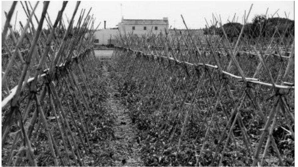
Can Constans, als terrenys del PP1

El passat 18 i 19 de desembre, el Consell Municipal de Medi Ambient, del qual forma part la Plataforma, va organitzar unes jornades per a la millora de la gestió dels residus municipals, amb una taula rodona de tècnics de procedència diversa i amb una exposició molt didàctica. L'objectiu d'aquestes jornades, més enllà del simple acte puntual, és que fos una "primera pedra" per promoure un canvi que també ha d'arribar a Pineda. El nostre municipi no pot restar al marge d'un procés al qual cada vegada s'incorporen més poblacions. La posada en marxa de l'Agenda 21 podria ser una bona ocasió per fer que la gestió dels nostres residus fos molt més eficient i respectuosa amb l'entorn i amb nosaltres mateixos.