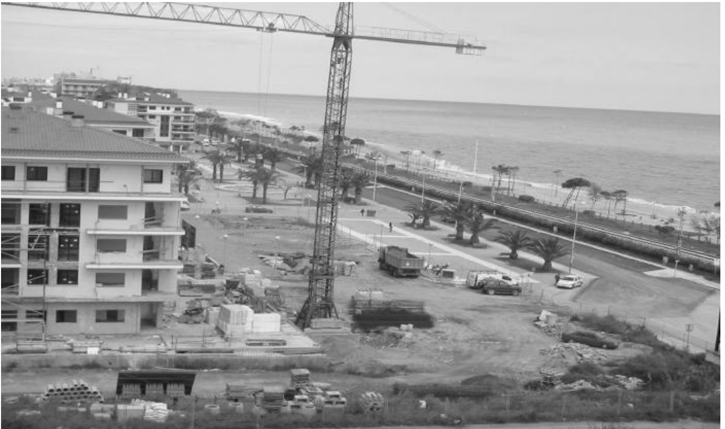
Les noves construccions estan acabant de tapar el front marítim

El Pla Director Urbanístic del Litoral permetrà la preservació de part dels sòls no urbanitzables de Pineda i de Santa Susanna. Pàgina 2