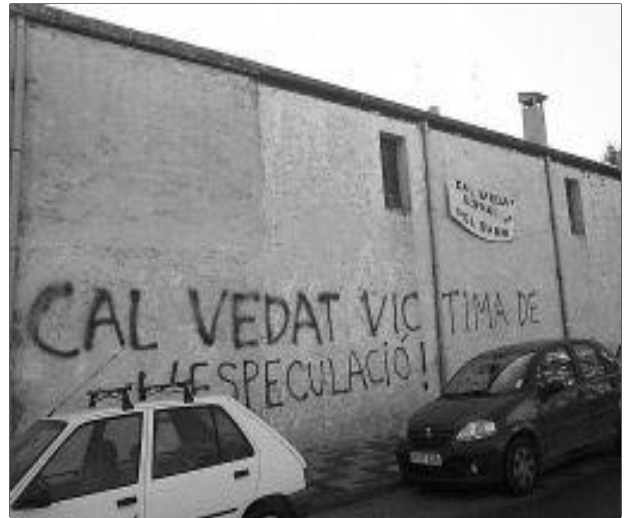
Masia de Cal Vedat

En tot el llarg historial que ja arrossega l'afer Cal Vedat, finalment, ha fet una passa decisiva per aconseguir la seva preservació, tal i com demanaven diverses entitats del barri. En efecte, els serveis tècnics de la Direcció General d'Urbanisme (DGU) de la Generalitat de Catalunya han elaborat un informe, amb data 9 de setembre de 2004 on, entre d'altres, es dóna suport a la preservació de Cal Vedat. Aquest informe és la resposta que la DGU ha fet davant la modificació puntual del Pla General d'Urbanisme de Pineda que afectava Cal Vedat. Com es recordarà, aquesta modificació permetia que la finca de Cal Vedat, amb una superfície total de 2.260,64 m 2 , passés de tenir una qualificació "d'urbana hotelera" a "urbana residencial". És a dir, que es passava de poder construir un hotel a construir pisos. Amb el canvi, es podia aixecar un bloc de pisos de 3 plantes d'alçada (+planta baixa) i prop de 50 m. de façana al llarg de tota l'avinguda Hispanitat, des del c/. Onze de Setembre al c/. Goya. Això suposava la demolició de la masia i la creació d'una barrera de formigó que ofegava i aïllava la zona verda que la propietat cedia a l'Ajuntament. També cal recordar que l'antic hotel "Tres Banderas", construït als anys 60, restava com a cessió d'equipaments.