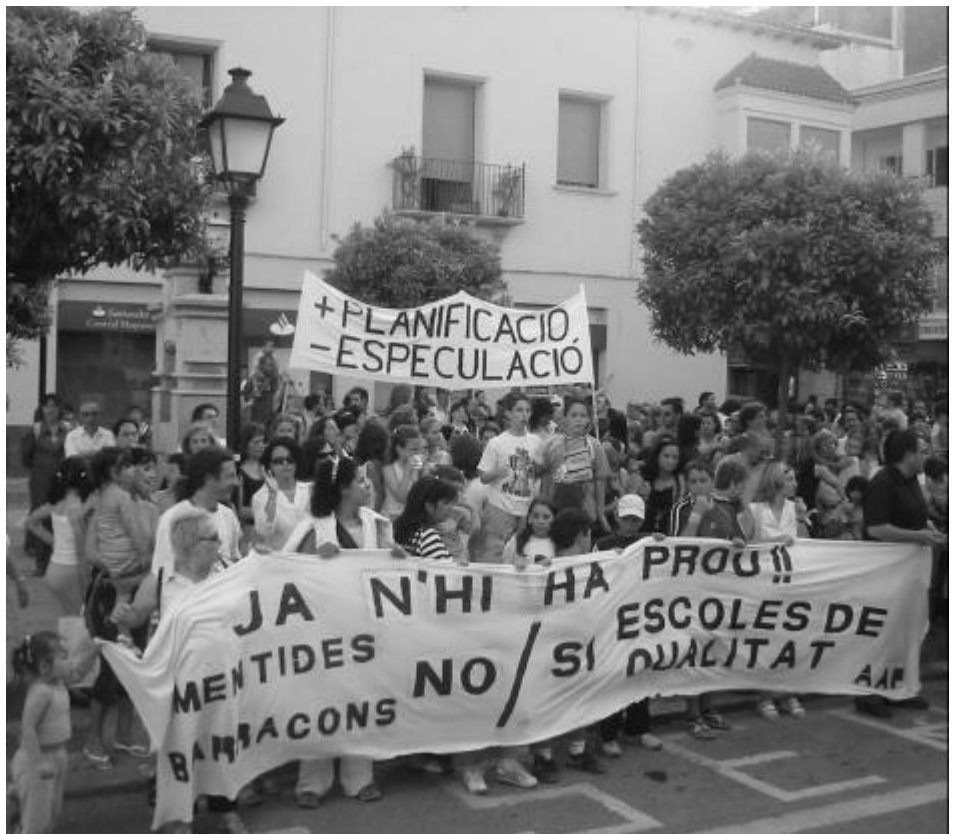
Manifestació reclamant places escolars. Hi ha terrenys per habitatges innecessaris i no n'hi ha per escoles

Al sector de Pineda-Santa Susanna, el Pla Director proposa la preservació, com a espai de màxima protecció, de bona part de la plana agrícola de Santa Susanna, el que es coneix com a Pla de Balasc. Aquest sector, a part de la importància que té per ell mateix, es veu molt revaloritzat pel fet que presenta una connexió directa amb el Parc Natural del Montnegre per mitjà del corredor forestal del turó de la Guàrdia. Dit d'altra manera, el Pla Director, estableix una única gran zona de protecció que va des de Sant Pere de Riu, cobreix el turó de la Guàrdia i arriba a la plana agrícola de Santa Susanna. L'eix que va des d'aquesta plana i que arriba fins al parc natural, passant pel turó de la Guàrdia, és un dels pocs punts de la comarca, entre el litoral i la muntanya, que encara es manté com a espai lliure no edificat . Val a dir que, en més de 30 kms. de costa, des de Mataró a la Tordera, no trobem un espai lliure agrícola tan extens com és la plana de Santa Susanna. La nostra valoració no pot ser altra que positiva.