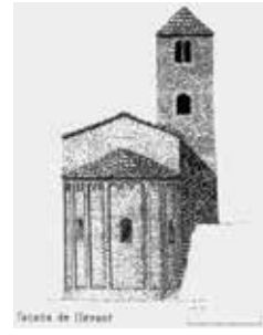
Reconstrucción ideal del templo románico de Sant Pere de Riu (1992)

C-32 y la depuradora de aguas residuales del Alt Maresme Nord 5 . El sendero no pierde la traza y penetramos en una zona más montañosa y boscosa presidida por la iglesia parroquial de Sant Pere de Riu 6 , de origen románico.